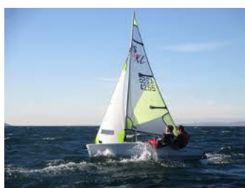
RS Feva S